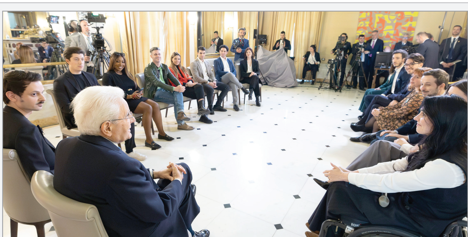
Il capo dello Stato Sergio Mattarella con un gruppo di giovani influencer