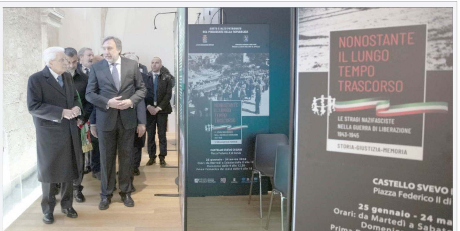
Mattarella a Bari visita la mostra "Nonostante il lungo tempo trascorso: le stragi nazifasciste nella guerra di liberazione 1943-1945"