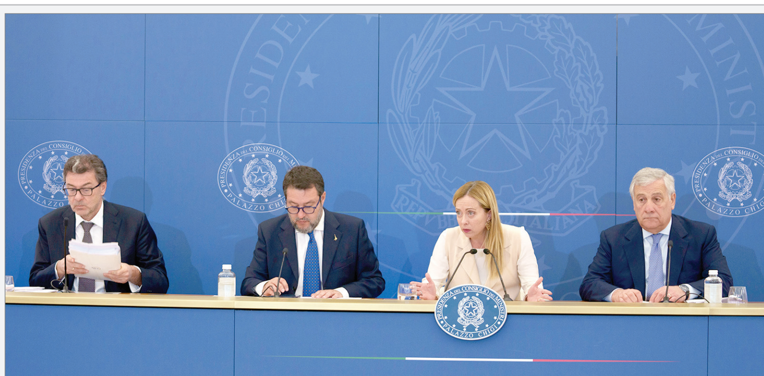
La premier Giorgia Meloni insieme ai ministri Giancarlo Giorgetti, Matteo Salvini e Antonio Tajani