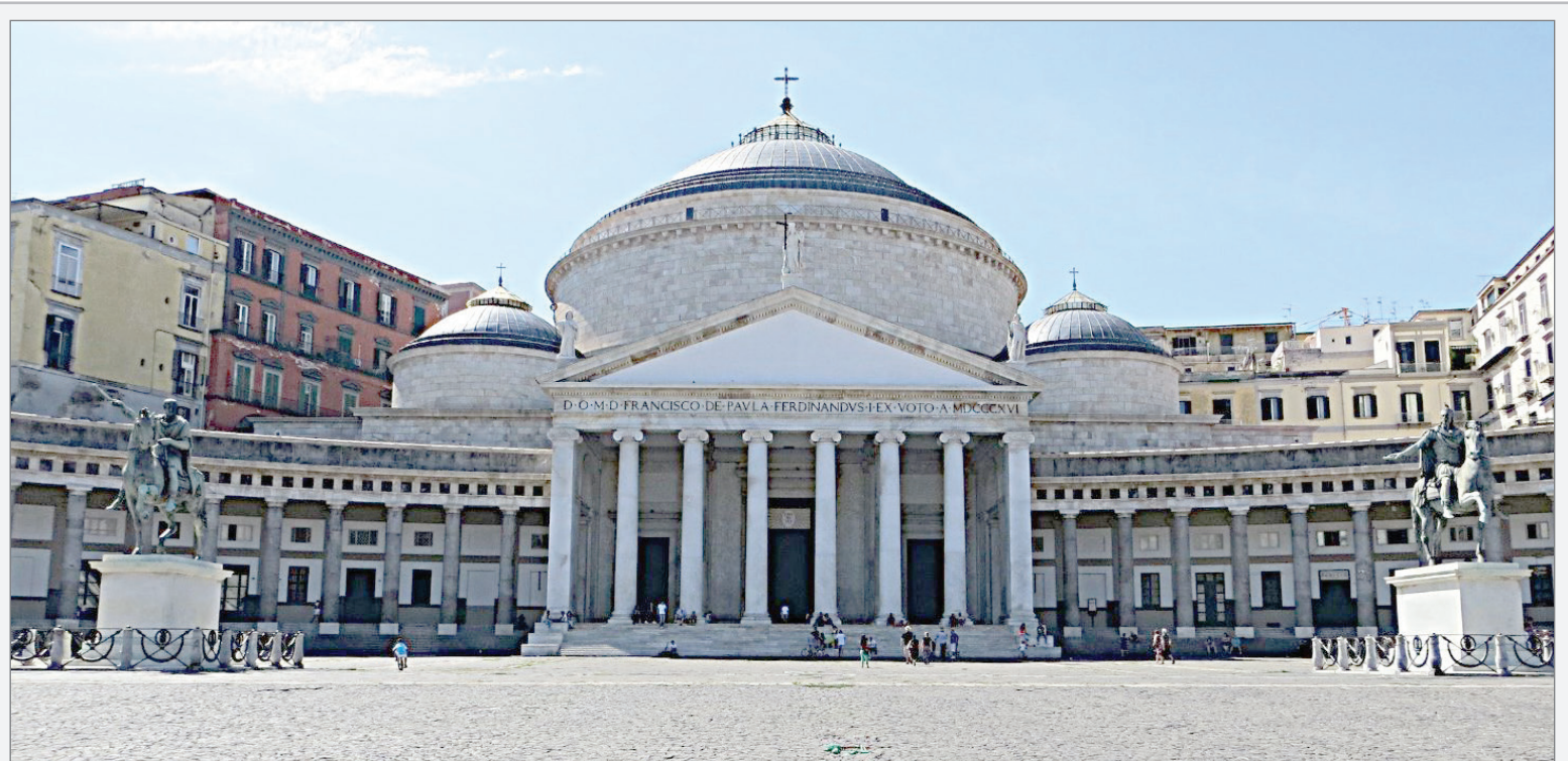
Una veduta della Piazza del Plebiscito a Napoli